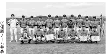
優勝チームの写真