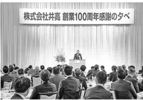
講演会に続いて行われた感謝の夕べ