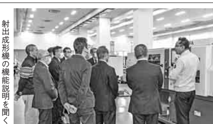
見学会の様子の写真