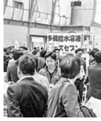
ワンマンショーの名称が復活した展示会