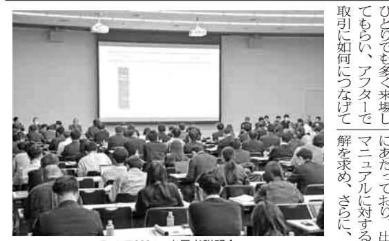
R T J 2024 出展者説明会

『ROBOTTECHNOLOGY JAPAN』ロボット・テクノロジ・ジャパ R T J 開催規模は前回の20%増 出展者説明会 開幕向け満を持す